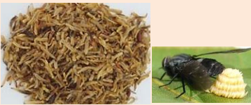
[うじ虫(ハエの幼虫)佃煮など]