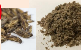
[コオロギ(コオロギパウダー)]