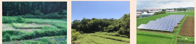
日本全国に広がる休耕地・耕作放棄地